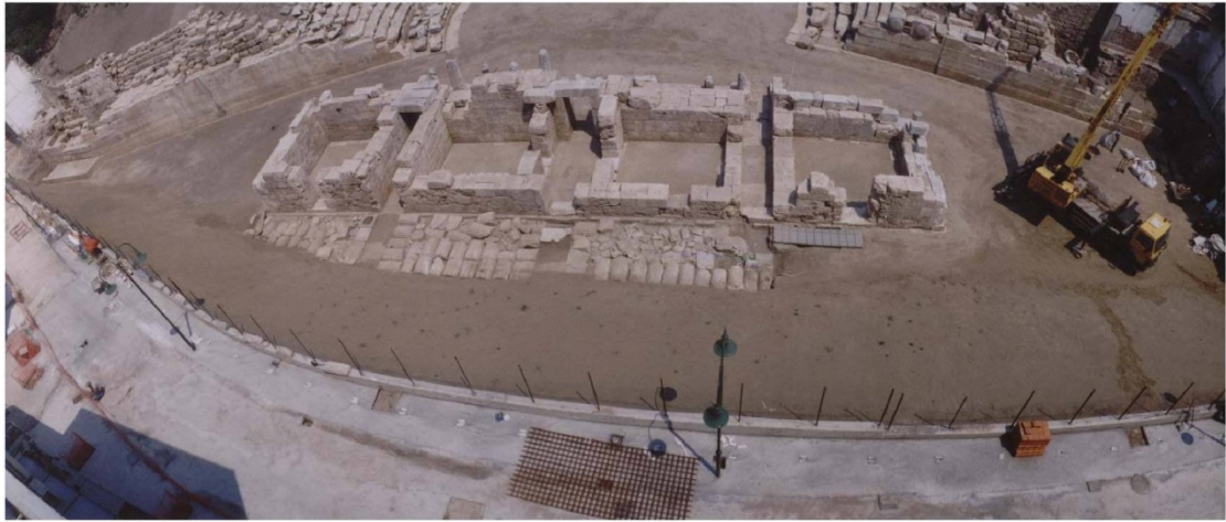
Εικ. 26 Γενική άποψη της σκηνής.