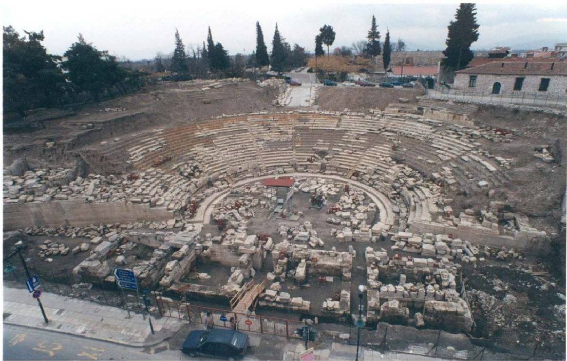
Εικ. 18 Η εικόνα του μνημείου το 2001.