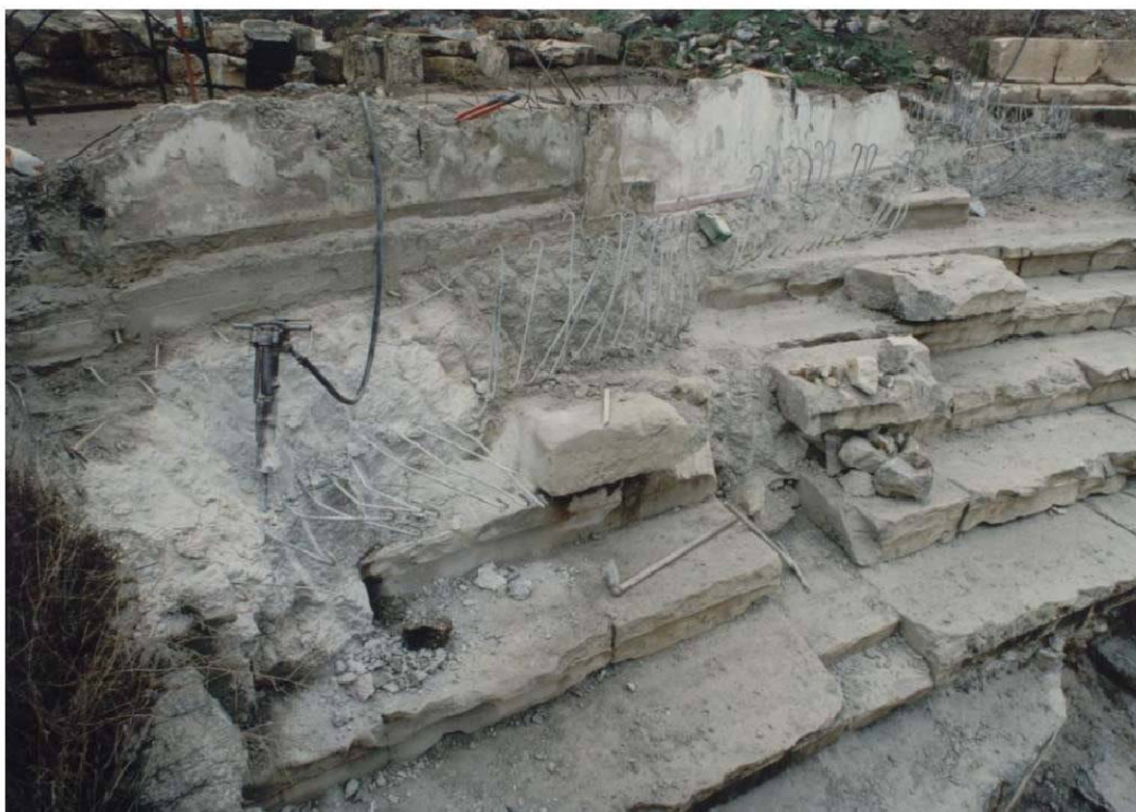
Εικ. 3 Κατεδάφιση θεμελίων οικοδομής Γκαράνη.