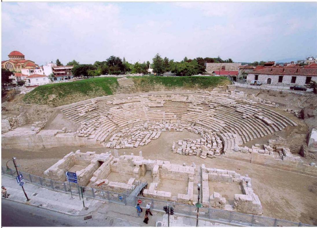
Εικ. 22 Η εικόνα του μνημείου το α' εξάμηνο του 2005.