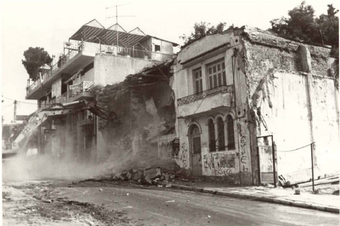
Εικ. 8 Κατεδάφιση επισκοπικού μεγάρου.