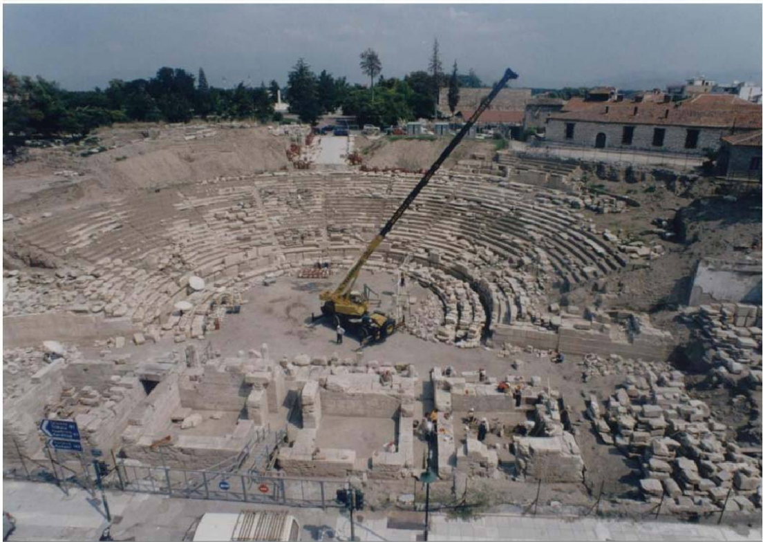
Εικ. 20 Η εικόνα του μνημείου το 2003.