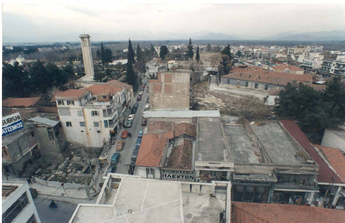
Εικ. 2 Η εικόνα του μνημείου το 1987.