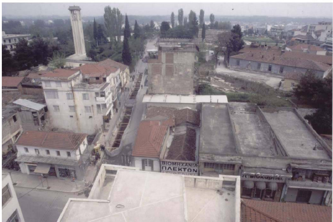
Εικ. 1 Η εικόνα του μνημείου το 1985. Διάνοιξη δοκιμαστικής τομής επί της οδού Παπαναστασίου.