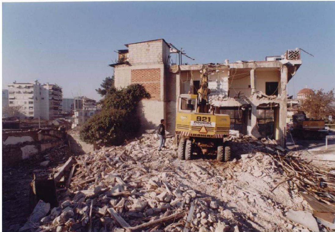
Εικ. 15 Η κατεδάφιση αικινήτων της τρίτης φάσης απαλλοτριώσης 1999.