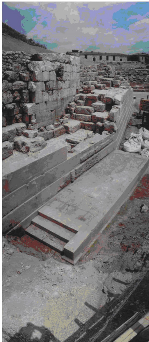
Εικ. 25 Γενική άποψη της κλίμακας της δυτικής παρόδου.