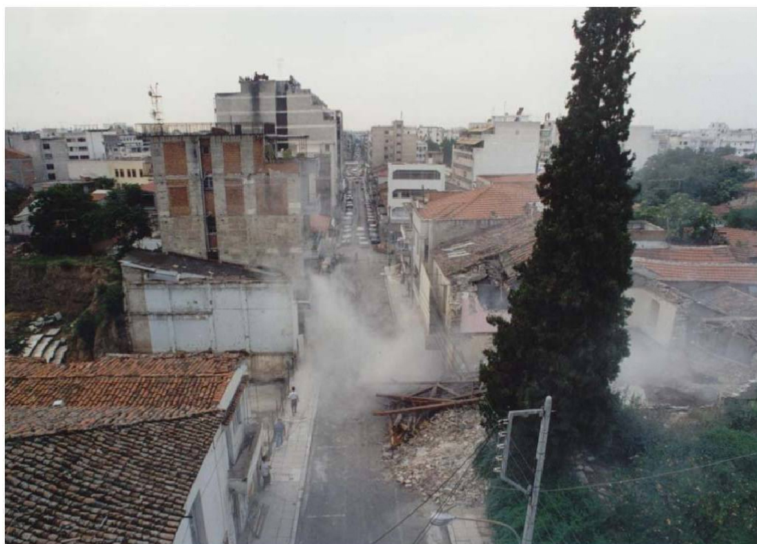
Εικ. 4 Η κατεδάφιση των ακινήτων του 1992. Η πρώτη μεγάλης κλίμακας απαλλοτρίωση.