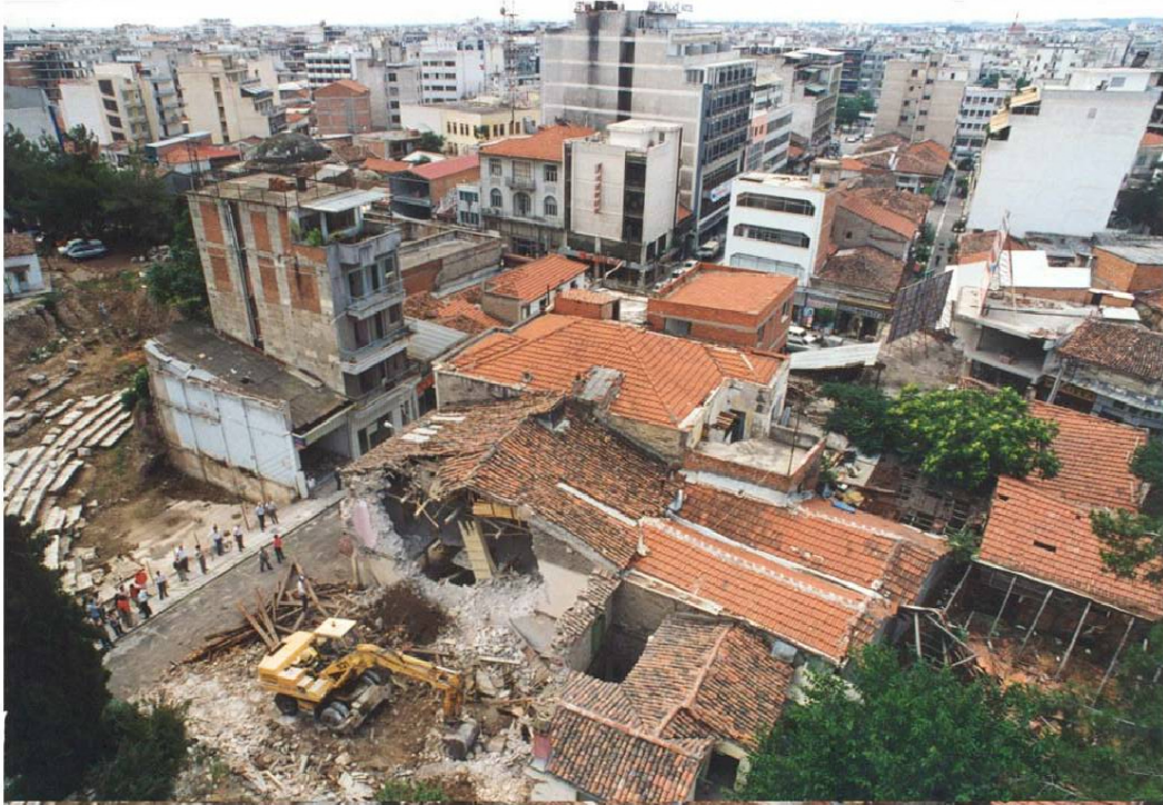
Εικ. 5 Η κατεδάφιση των ακινήτων του 1992 - Η πρώτη μεγάλης κλίμακας απαλλοτριώση.