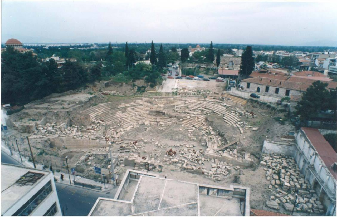
Εικ. 16 Η εικόνα του μνημείου το 2000.