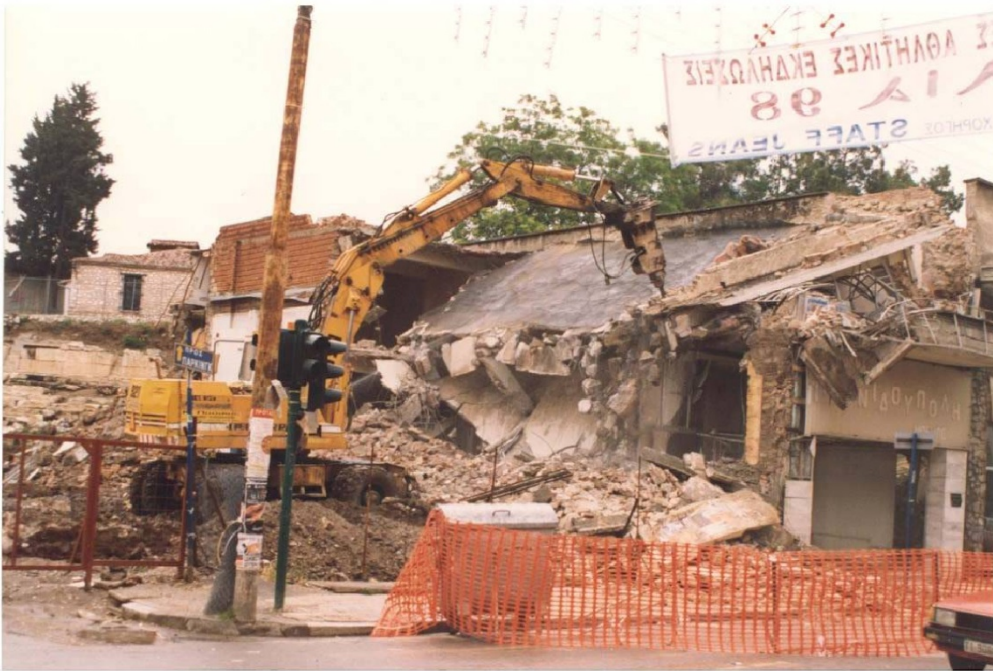
Εικ. 10 Η κατεδάφιση των ακινήτων του 1998. Η δεύτερη φάση μεγάλης απαλλοτριώσης.