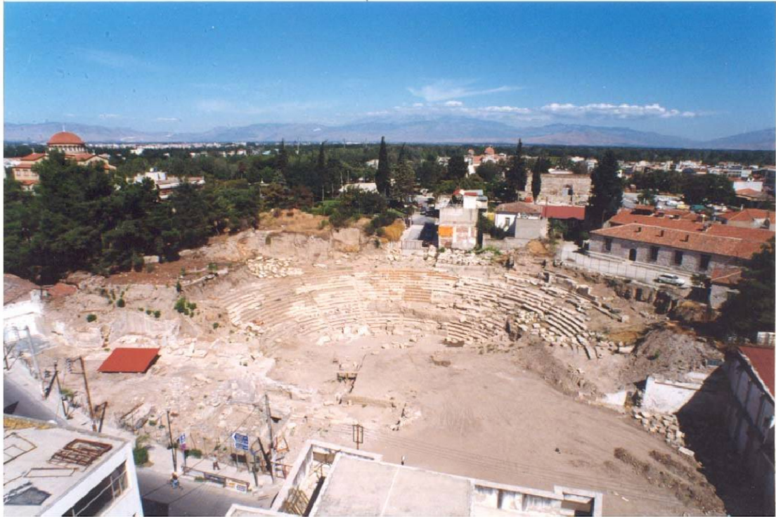
Εικ.14 Γενική άποψη του θεάτρου μετά τις κατεδάφισεις του 1998.