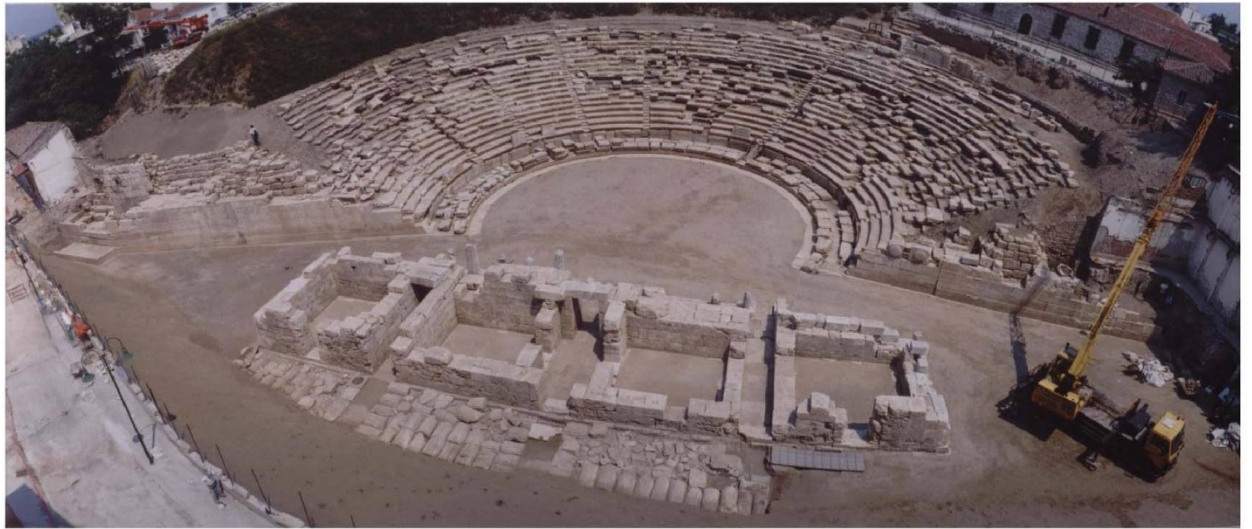
Εικ. 24 Γενική άποψη των αναλημματικών τοίχων του θεάτρου.