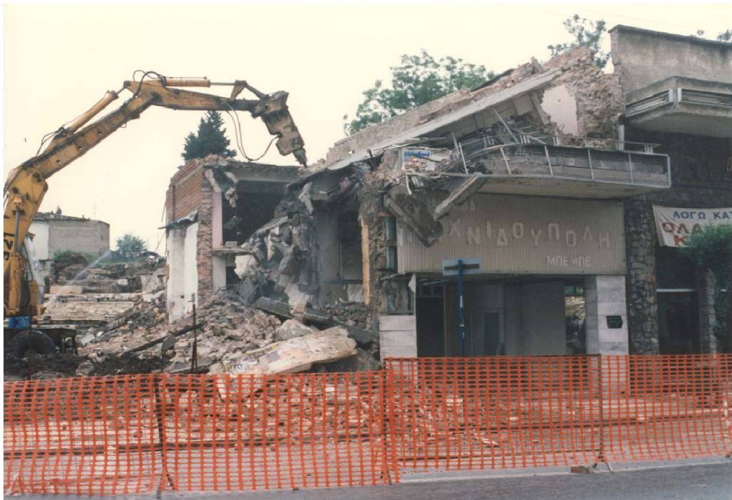
Εικ. 11 Η κατεδάφιση των ακινήτων του 1998. Η δεύτερη φάση μεγάλης απαλλοτριώσης.