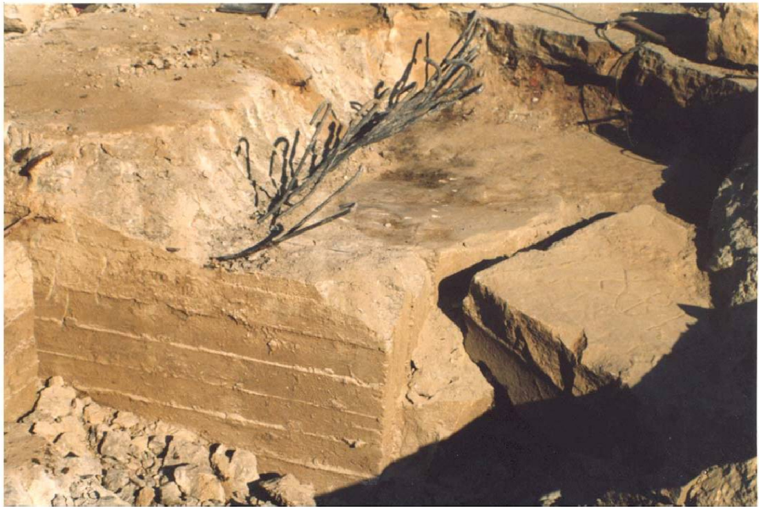
Εικ. 13 Κατεδάφιση θεμελίων οικοδομής Γκαράνη 1998.