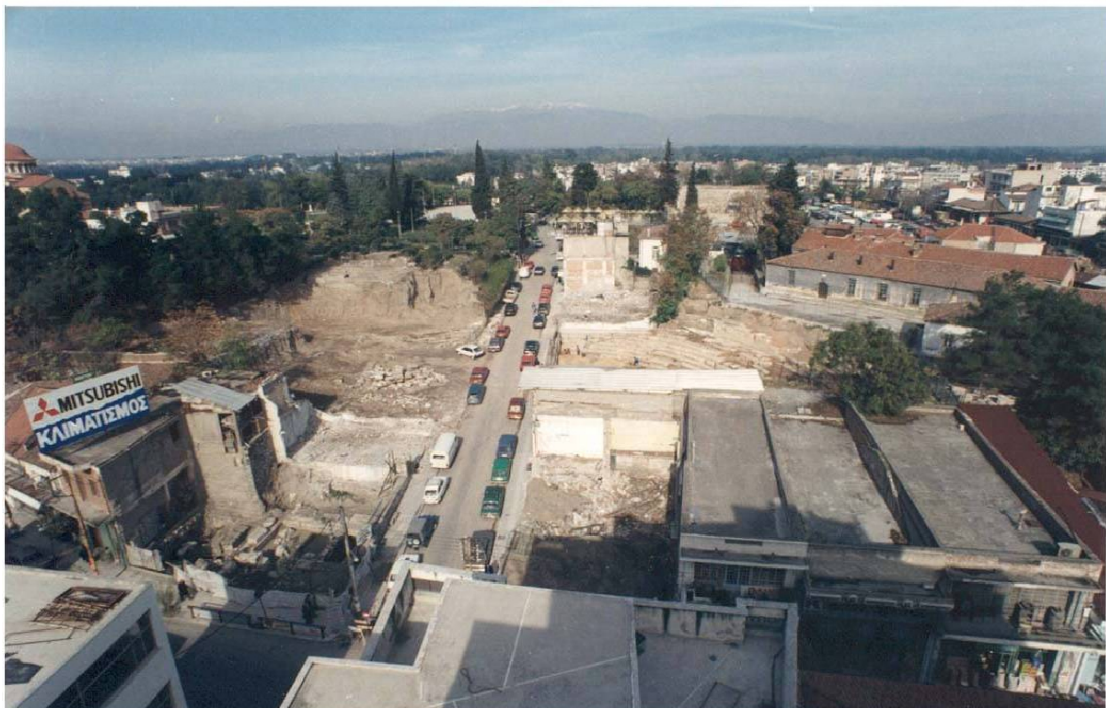
Εικ.6 Η εικόνα του μνημείου μετά τις κατεδαφίσεις του 1992.