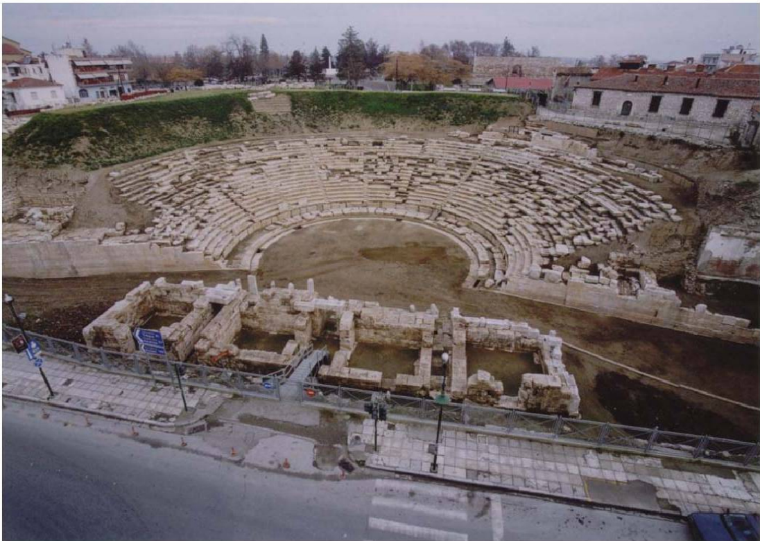
Εικ. 23 Η εικόνα του μνημείου το β' εξάμηνο του 2005.