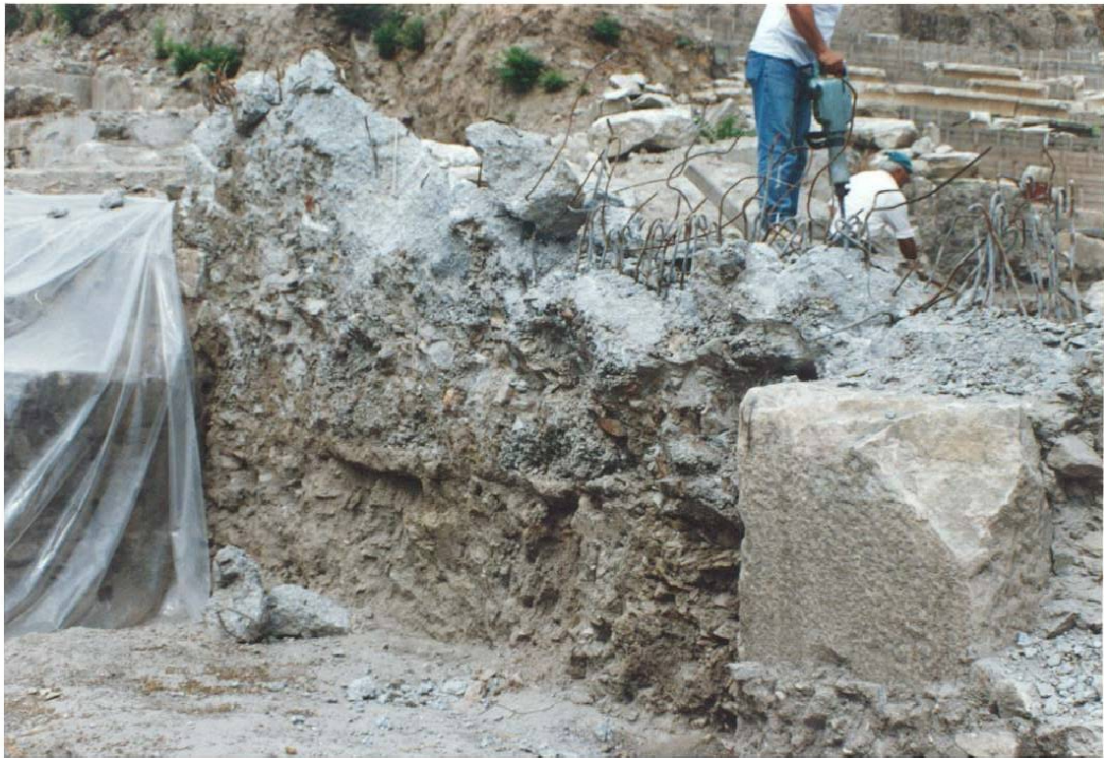
Εικ. 12 Κατεδάφιση θεμελίων πολυκατοικίας 1998.