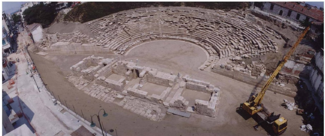
Εικ. 27 Η εικόνα του μνημείου το Σεπτέμβριο του 2006.