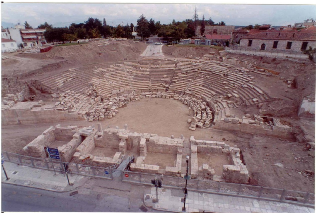
Εικ. 21 Η εικόνα του μνημείου το 2004.