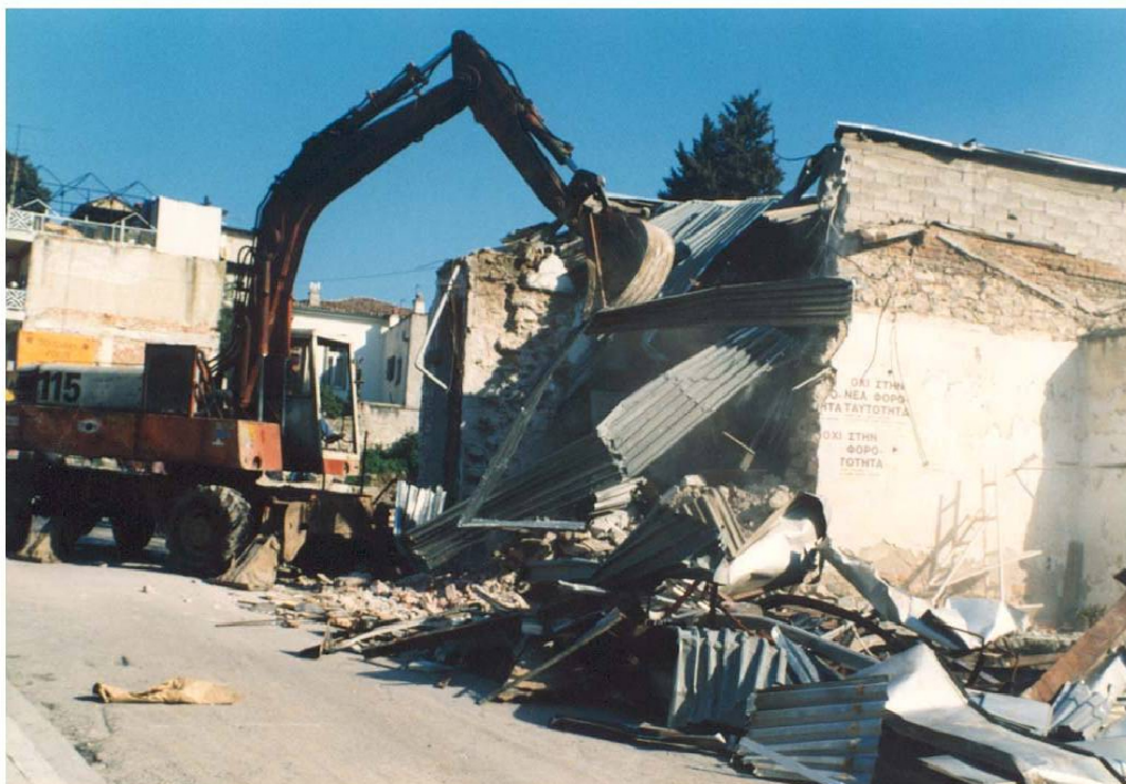
Εικ. 9 Κατεδάφιση των ακινήτων του 1998. Η δεύτερη φάση μεγάλης απαλλοτριώσης.